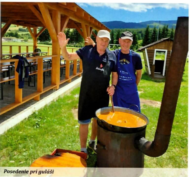
Posedenie pri guláši