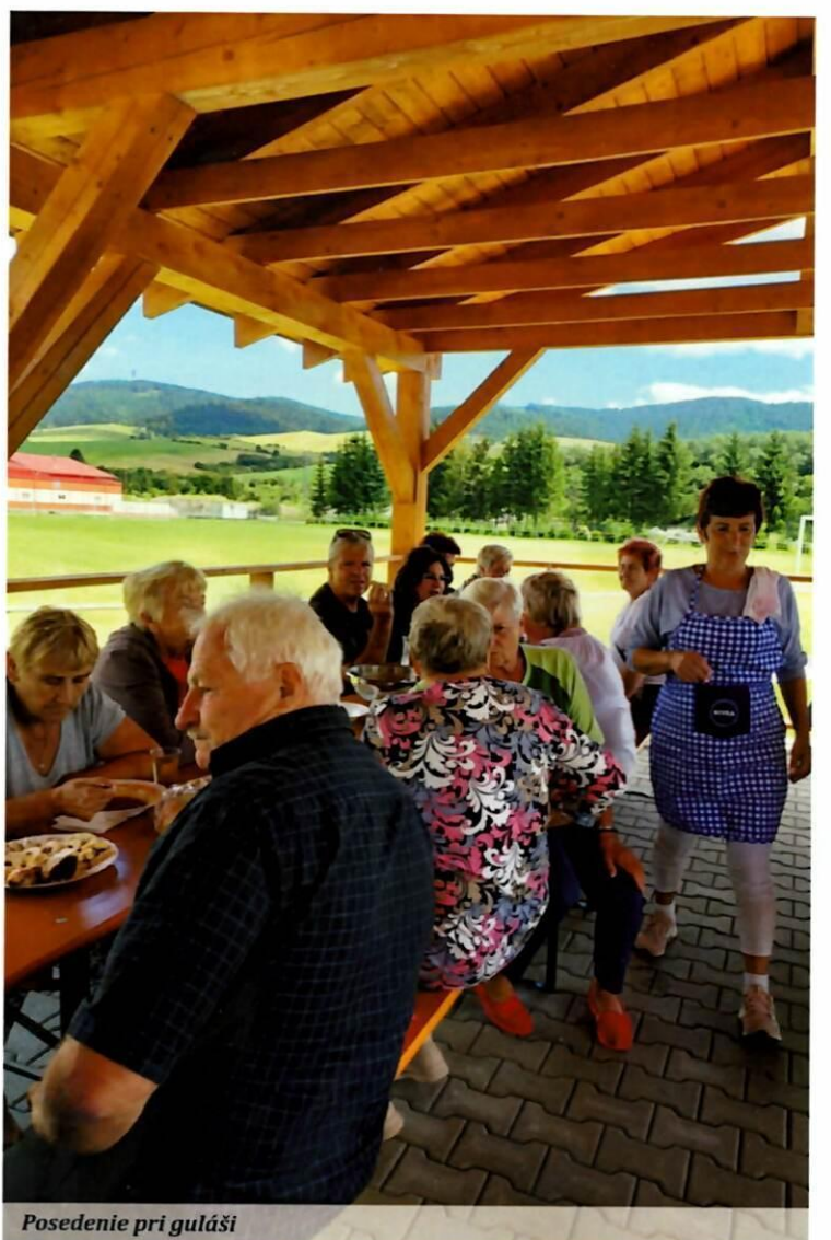
Posedenie pri guláši