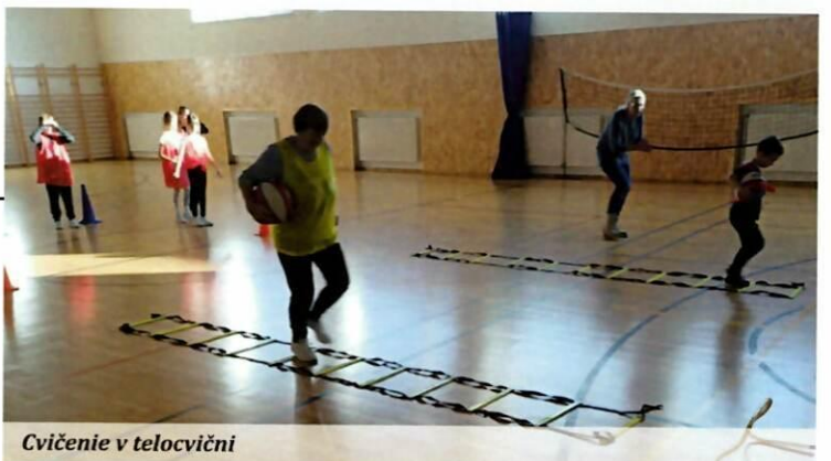
Cvičenie v telocvični