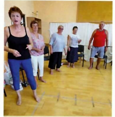
Tanečno - program pre seniorov