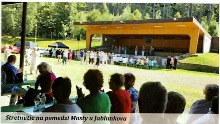
Stretnutie na pomedzi Mosty u Jablunkova