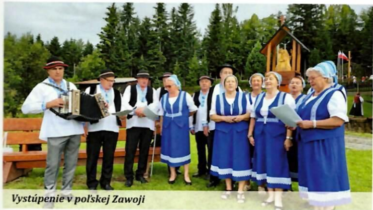
Vystúpenie v poľskej Zawojsi